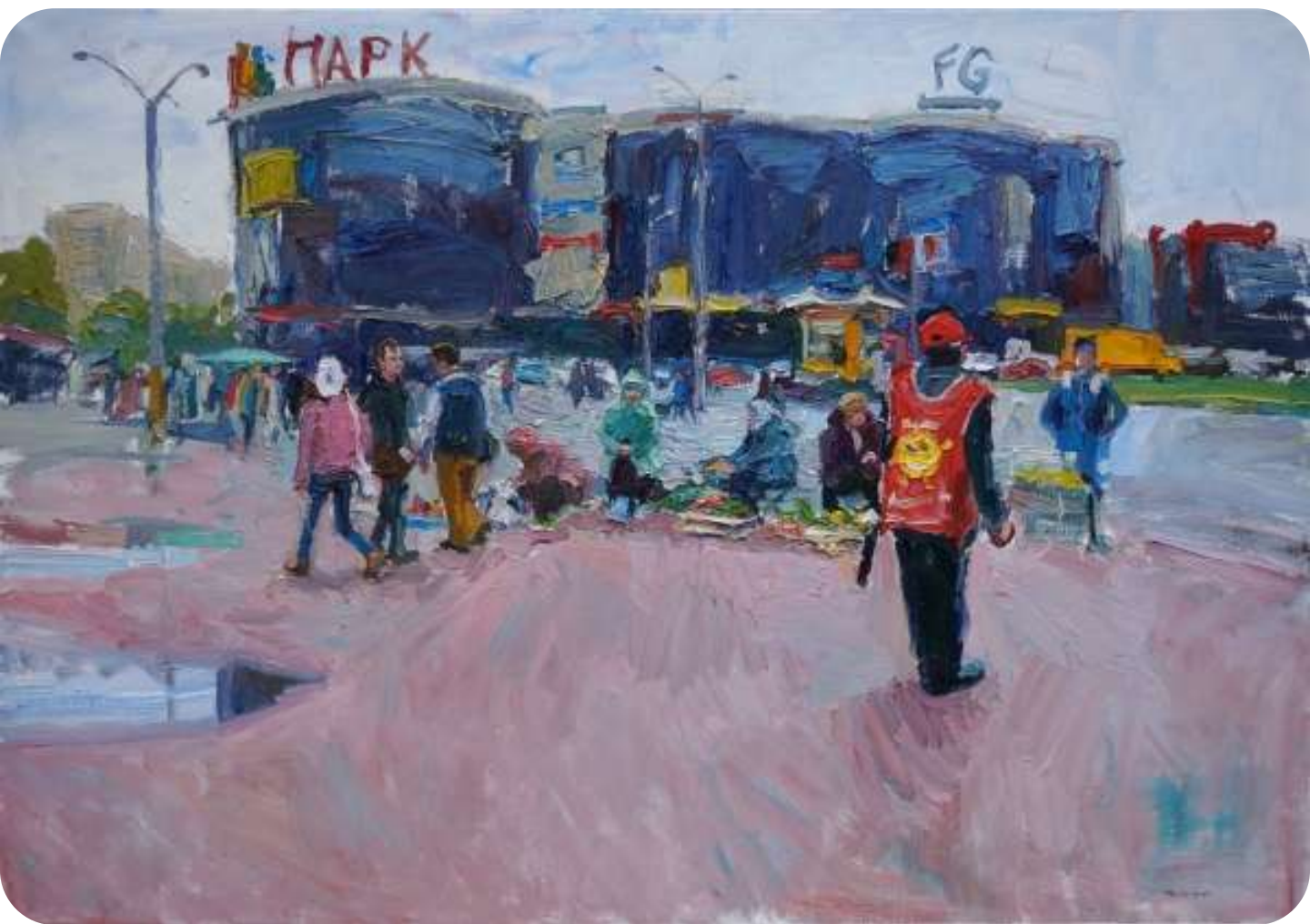
« Akademicheskaya », huile sur toile 120x170cm

Akademicheskaya est une station de métro à St Pétersbourg en Russie. La toile montre une scène de la sortie de ce métro. Les grands centres commerciaux surplombent les grand-mères qui vendent leurs légumes.