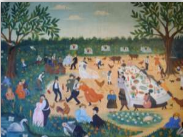
Le mariage à la campagne, Lettron

Et 120 ex-voto sont exposés depuis quelques années : 60 de la collection Jacques Lagrange confiée au musée et 60 de la collection Jeannine et Jacques Geysant .