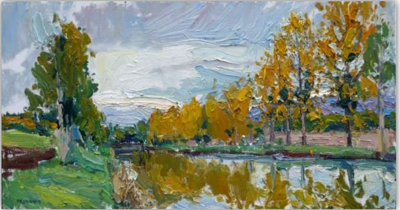
« Le canal de Bourgogne en Automne », huile sur toile 50x100cm