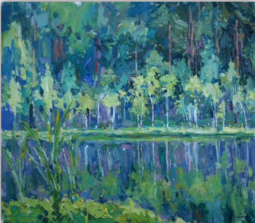
« Le lac de l'ours », huile sur toile 70x80cm

L'ours l'aime pour les baies et les fourmières.